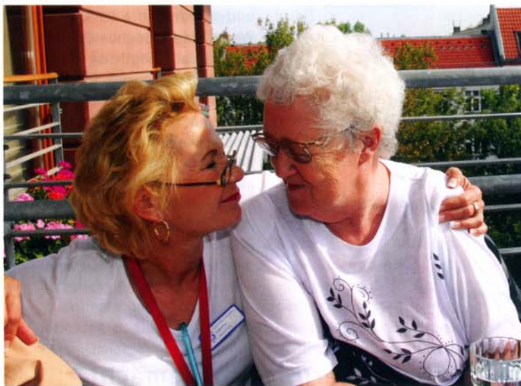
Immer erst den Blickkontakt herstellen und dem schwerhörigen Menschen beim Sprechen das Gesicht zuwenden.

Beratungs- und Informationszentrum (HörBIZ) sind fachlicher Austausch, Beratung und kontinuierliche Weiterentwicklung des Kompetenzzentrums gewährleistet. Weiterhin gibt es ein regelmäßiges Zusammenwirken mit HNO-Ärzten und einem Hörgeräteakustiker, um dem hohen Qualitätsanspruch zu genügen. Das alles wurde durch die Seniorenstiftung Prenzlauer Berg mit Eigenmitteln realisiert, da die Kassen Hörschädigung nicht als Pflegemerkmal für eine Pflegestufe betrachten und daher kein erhöhter Pflegebedarf gesehen wird.