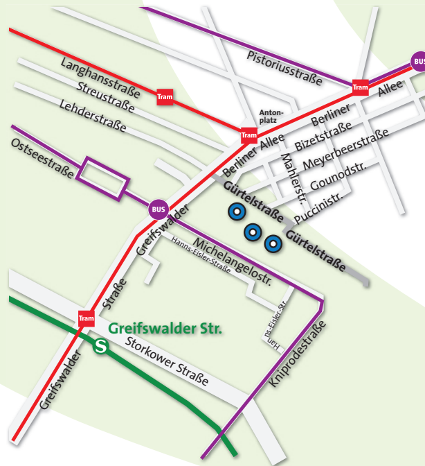
verbium_Mai 2011_1000 Stück

Service-Telefon: 030 / 42 84 47-2117 E-Mail: vermietung@seniorenstiftung.org